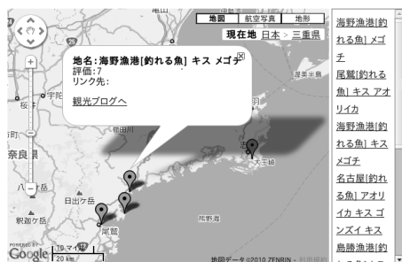
図2 地域情報獲得システム実行例